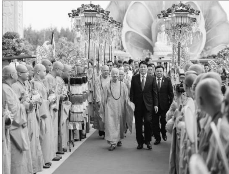
Chủ tịch nước Lương Cường và Đức Pháp chủ Thích Trí Quảng.

Theo người đứng đầu nhà nước, tình hình thế giới hiện nay và những năm tới, hòa bình, hợp tác, phát triển vẫn là xu thế chủ đạo; song, đang đối mặt với nhiều khó khăn, thách thức như chiến tranh, xung đột, biến đổi khí hậu, bất bình đẳng, đói nghèo và những hệ lụy của thiên tai dịch bệnh toàn cầu. Chủ tịch nước đề nghị cần đưa “tâm từ bi” vào chính sách, mang “trí tuệ” vào định hướng phát triển, đề cao tinh thần