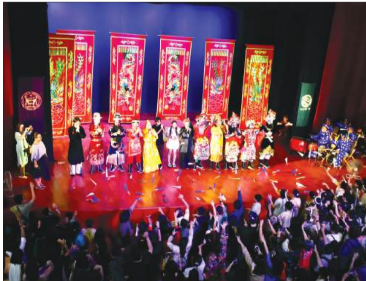
Đông đảo khán giả trẻ tham gia buổi diễn kết thúc chương trình “Ca biện phần hành” của nhóm Hiếu Văn Ngự.

Trước đó, Hiếu Văn Ngự đã triển khai nhiều “giờ học” về hát bội để cung cấp kiến thức nền tảng, tạo hứng thú, giúp