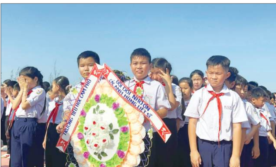
Các thế hệ sau bày tỏ lòng biết ơn và nguyện tiếp nối tinh thần quả cảm của thế hệ cha anh.