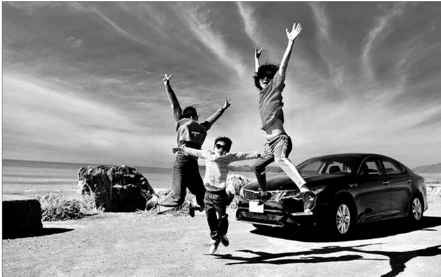
Ô tô cá nhân đang trở thành người bạn đồng hành lý tưởng cho các gia đình Việt trong những chuyến du lịch.

Hệ thống đường bộ tại Việt Nam, với nhiều tuyến quốc lộ và cao tốc hiện đại, cũng tạo điều kiện thuận lợi cho xu hướng này. Các cung đường như Hà Nội - Hà Giang, TP.HCM - Đà Lạt hay các tuyến ven biển miền Trung đều được nâng cấp, mang đến trải nghiệm lái xe an toàn và thoải mái. Trên hành trình, gia đình có thể dừng lại để chụp ảnh, thưởng thức đặc sản địa phương hoặc đơn giản là hít thở không khí trong lành của thiên nhiên.