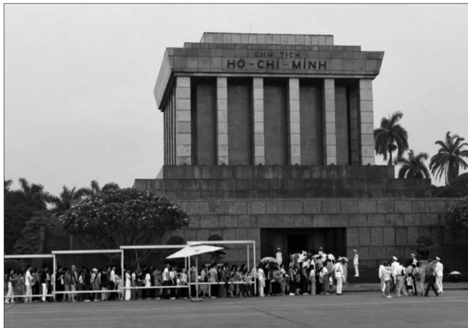
Cán bộ, nhân viên, chiến sĩ Bộ Tư lệnh Lăng Chủ tịch Hồ Chí Minh đã giữ gìn và bảo vệ tuyệt đối an toàn Thi hài Bác.

Dấu mốc thứ hai là từ ngày đón Bác về yên nghỉ tại Lăng, ngày 18/7/1975, trong điều kiện không gian rộng, thiết bị kỹ thuật nhiều, hiện đại, công tác bảo đảm thông số, bảo đảm an ninh, đón tiếp đặt ra yêu cầu cao. Đây là sự khởi đầu của công tác quản lý, vận hành hệ thống thiết bị kỹ thuật Công