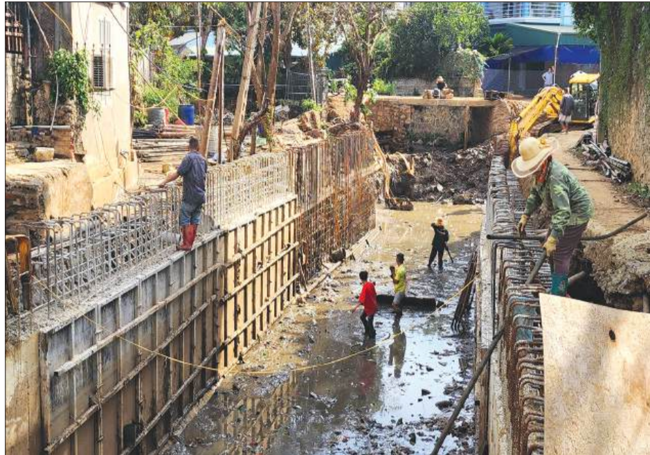
Những trận mưa lớn đổ về cùng bùn đất gây khó khăn cho việc thi công.

Dự án thoát lũ khu vực Chiềng Sinh về trung tâm TP Sơn La đoạn từ trung tâm thương mại Đ&T, thuộc tổ 10, phường Quyết Tâm đến ngã tư Quyết Thắng có chiều dài tuyến 1,4km; đoạn từ ngã tư Quyết Thắng đến khu đô thị An Phú dài hơn 200m. Dự án có tổng