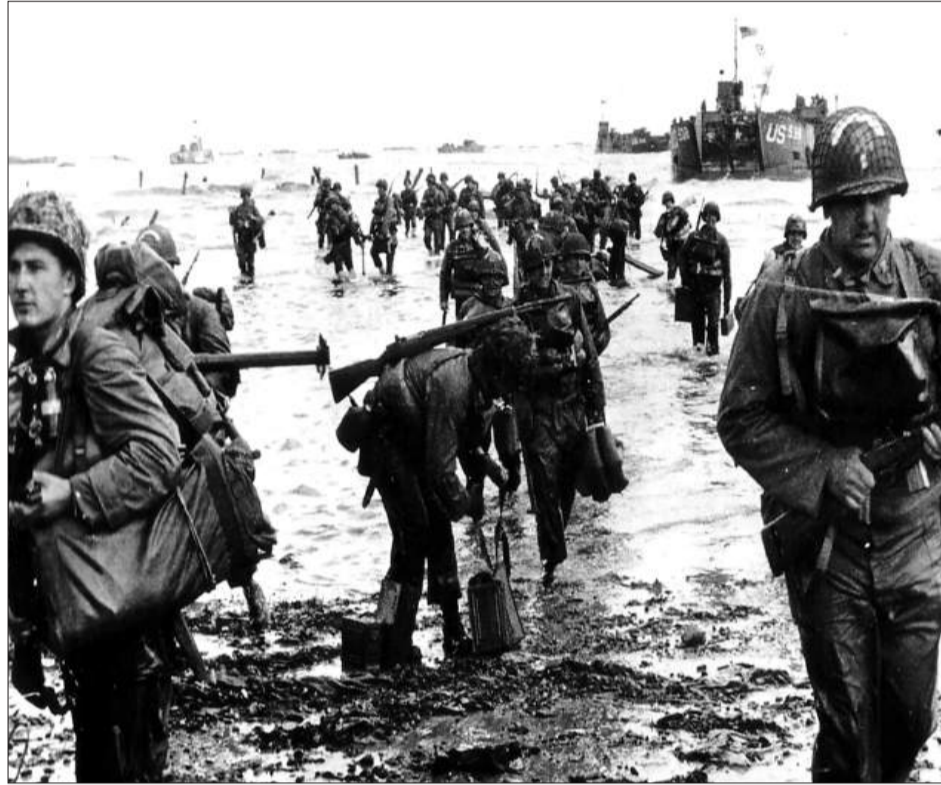
Ngày nay, người Đức nhìn nhận D-Day như biểu tượng của hy sinh và tự do mà các nước đồng minh mang lại.