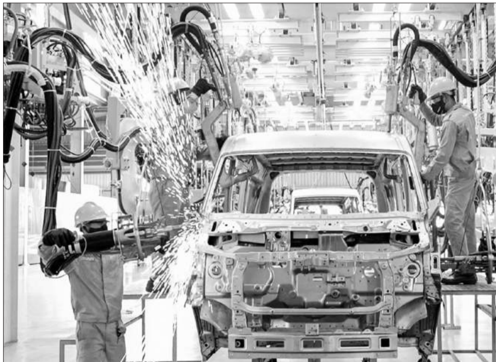
Nghị quyết 68 được coi là bước ngoặt lịch sử mới cho sự phát triển của kinh tế tư nhân.

Nghị quyết 68 nêu rõ Việt Nam đặt mục tiêu có 2 triệu doanh nghiệp đến 2030, tương ứng 20 doanh nghiệp trên 1.000 người dân. Trong số đó, ít nhất 20 doanh nghiệp lớn tham gia chuỗi giá trị toàn cầu.