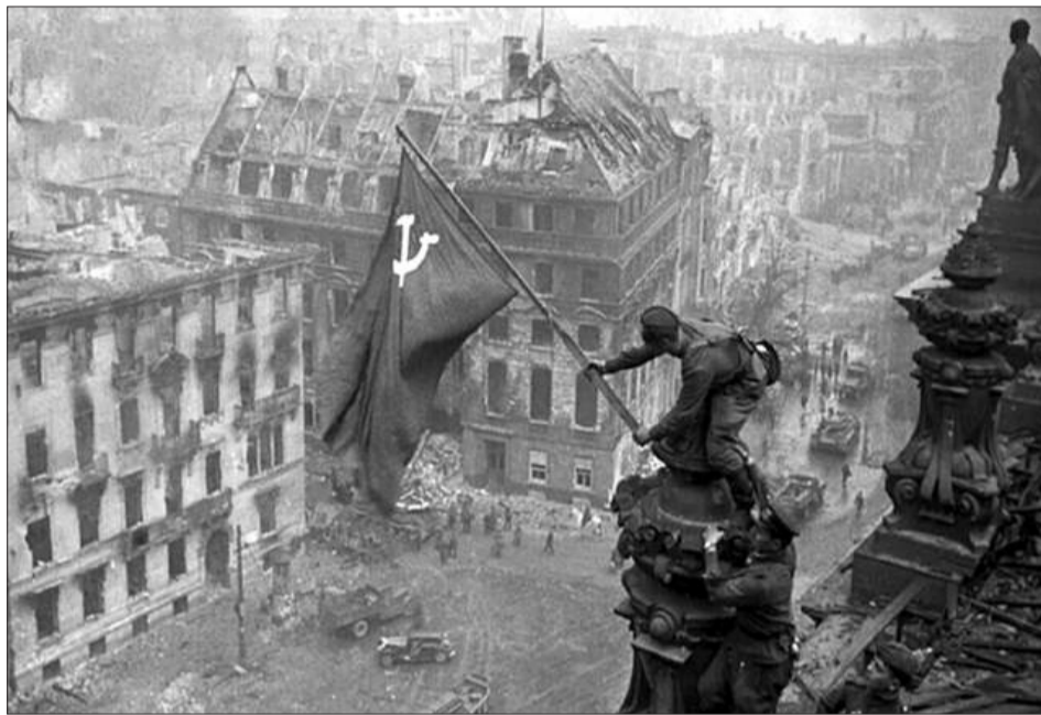
Chiến sĩ Hồng quân phát quân kỳ chiến thắng trên nóc tòa nhà Reichstag.