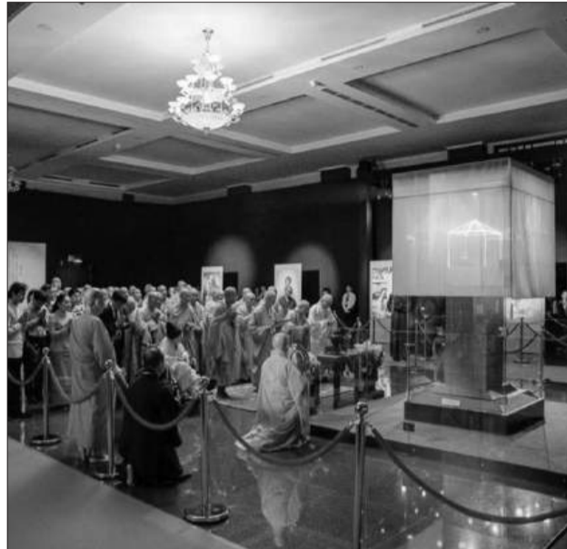
Lễ khai mở xá lợi Bồ tát Thích Quảng Đức.