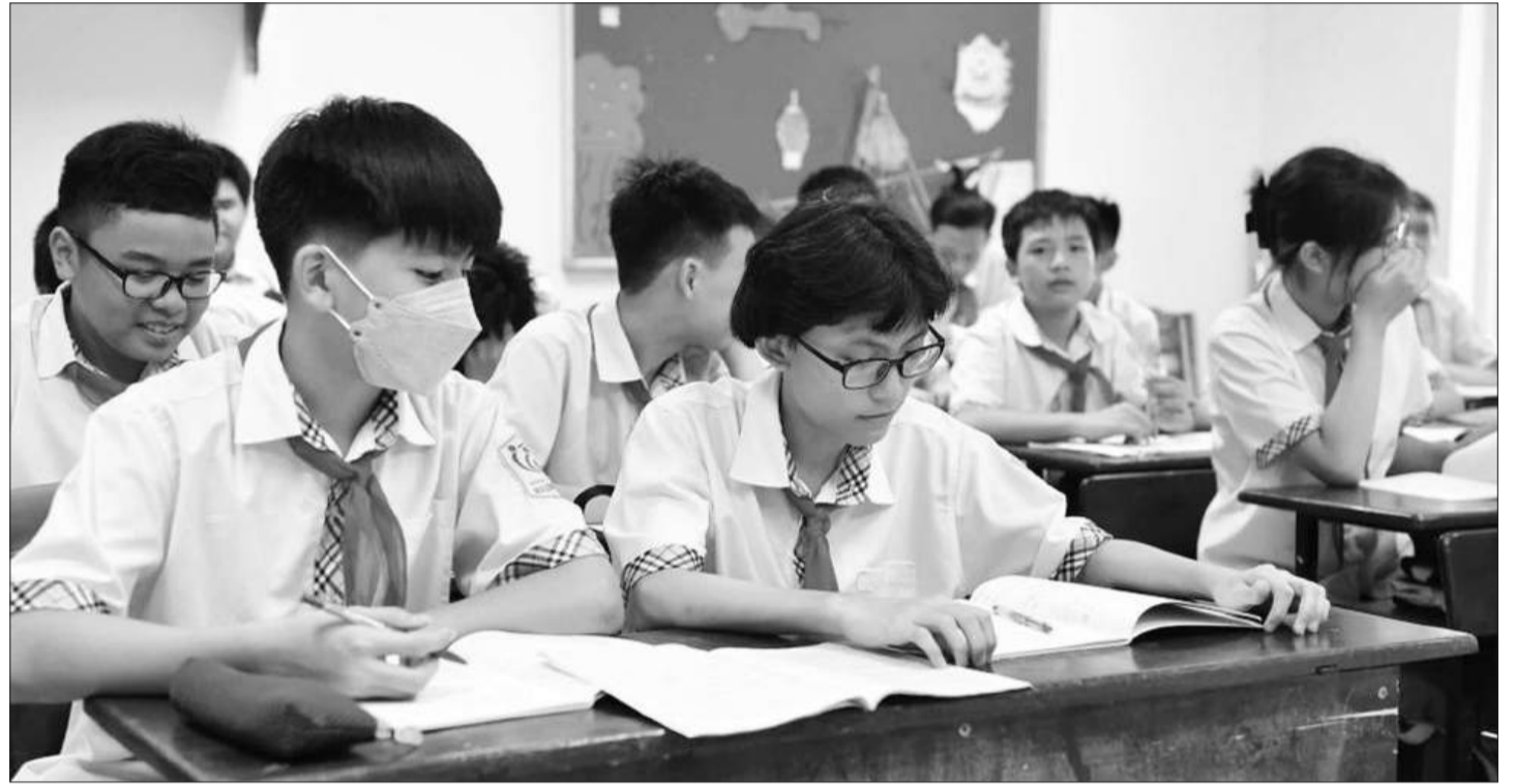
Sẽ chỉ có khoảng 64% số học sinh dự thi đỗ vào lớp công lập.