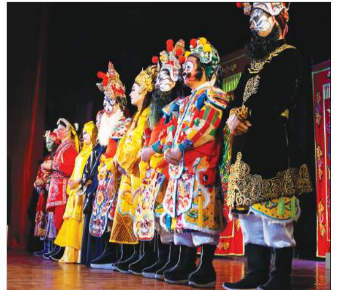
Giới thiệu các diễn viên trước buổi diễn.

Nghiên cứu, lưu trữ, truyền dạy và ứng dụng sáng tạo là 4 định hướng hoạt động của Hiếu Văn Ngự từ ngày thành lập đến