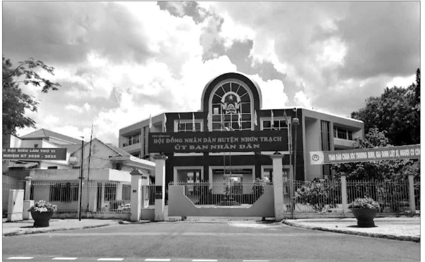
Trụ sở UBND huyện Nhon Trạch, tỉnh Đồng Nai.

Theo báo cáo của Chính phủ gửi Quốc hội và các đại biểu Quốc hội về xử lý vấn đề phát sinh khi sắp xếp bộ máy nhà nước