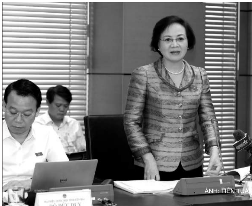
Theo Bộ trưởng Bộ Nội vụ Phạm Thị Thanh Trà, nhiều quy định đột phá đang được thiết kế để chính quyền gần dân, sát dân, phục vụ dân tốt hơn.

Dẫn số liệu rà soát cho thấy việc phân quyền đang bị “nghe” khi có tới 286 luật quy